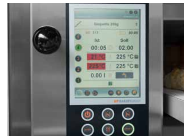
WP NAVIGO II PROFI-CONTROL

L'écran tactile et les pictogrammes de la WP NAVIGO II PROFI-CONTROL permettent de piloter le MATADOR® MDE en toute simplicité – même pour du personnel temporaire. Vous pouvez enregistrer 250 programmes avec chacun jusqu'à 20 étapes, rédiger facilement des recettes personnalisées et définir séparément des programmes pour chaque sole.