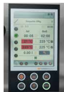
// WP NAVIGO II PROFICONTROL plus