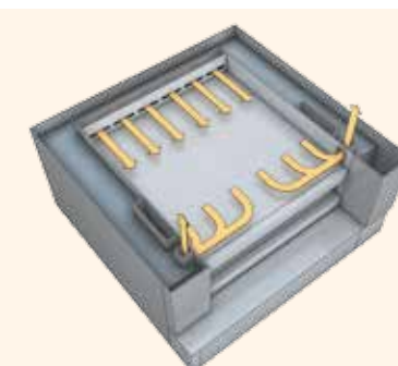
// Système de répartition de la vapeur